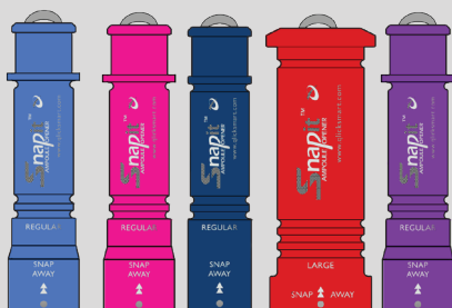
Otwieracze ampułek SnapIT i SnapIT Lite