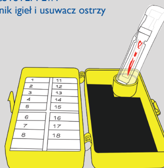
BladeNeedleSYSTEM 2w1 Sterylny licznik igieł i usuwacz ostrzy